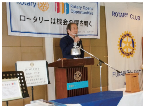
本日の卓話「コロナ禍・激変の世界」織戸会員